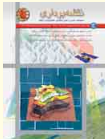
قیمت ۱۰۰۰ تومان