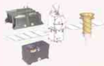
شکل ۳: تجهیزات DORIS مستقر بر روی ماهواره ها

نوسان ساز، شبکه جهانی ایستگاه های مستقل زمینی، مرکز کنترل و پردازش موقعیت مدار ماهواره ها و نرم افزار محاسبه همزمان موقعیت به نام Diode می باشد.