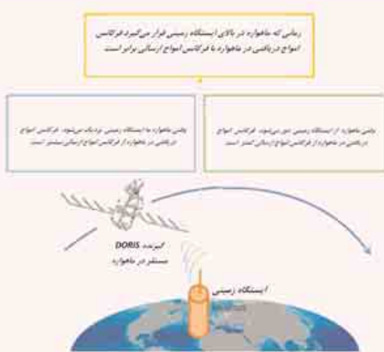
شکل ۲: نحوه عمل سامانه DORIS

می باشد. فرکانس ۴۰۷۲۵ مگاهرتز برای کاهش خطاهای انتشار در یونسفر مورد استفاده قرار می گیرد. فرکانس ۴۰۷۲۵ مدوله شده و حاوی شماره شناسایی ایستگاه، اطلاعات زمان، اطلاعات سنجنده هواشناسی و اطلاعات مهندسی (وضعیت انرژی ایستگاه و ...) می باشد.