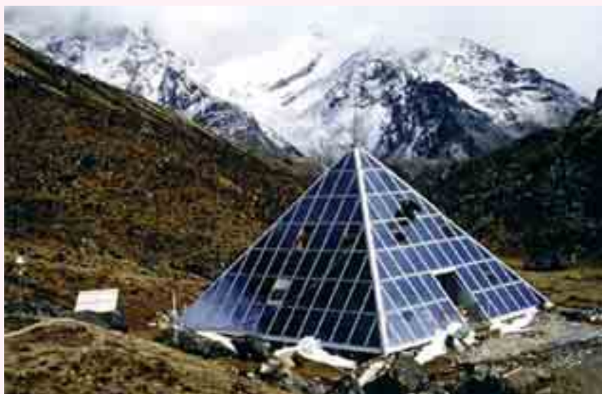
شکل ۵: ایستگاه زمینی DORIS در هیمالیا

نقشه برداری کشور فرانسه نسبت به ایجاد شبکه جهانی ایستگاه‌های زمینی DORIS اقدام نموده‌اند. در حال حاضر این شبکه شامل ۶۰ ایستگاه می‌باشد. این شبکه مستقل که در سراسر دنیا گسترده شده و نیمی از آنها در جزایر و یا سواحل قرار دارند مسیر حرکت ماهواره‌ها را پوشش می‌دهد. یک ایستگاه زمینی DORIS شامل یک برج دیده‌بانی ۳ ، یک آنتن جهت ارسال امواج ۴ در جهت خاص و مجموعه‌ای اختیاری از سنجنده‌های هواشناسی برای اندازه‌گیری فشار، درجه حرارت و طوبت هوای باشد. برج‌های دیده‌بانی در سه نوع دائم، مرجع و موردی می‌باشند. برج‌های دیده‌بانی مرجع جهت تعیین دقیق موقعیت مدار ماهواره‌ها مورد استفاده قرار می‌گیرند، سه برج مرجع این شبکه علاوه بر اینکه به شبکه برج‌های دائم تعلق دارند، وظیفه هم‌زمانی سامانه با زمان اتمی بین‌المللی را نیز بر عهده دارند. برج‌های موردی نیز به صورت موقت برای فعالیت‌های ژئودتیک و ژئوفیزیک نصب می‌گردند.