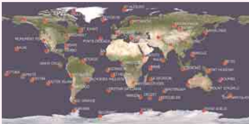
شکل ۴: شبکه ایستگاه‌های زمینی DORIS