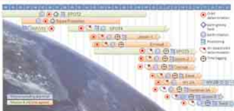
شکل ۶: ماهواره‌هایی که از سامانه DORIS استفاده نموده و یا خواهند نمود.