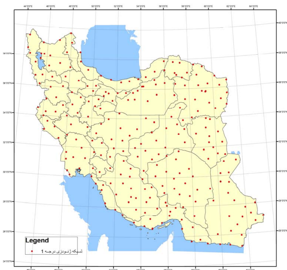
نگاره ۱_ شبکه ژئودزی درجه ۱

اندازه‌گیری مثلثها از شهریور ۱۳۶۷ شروع شد و تا اواخر پاییز ۱۳۶۹ ادامه یافت. از مجموع ۴۳۷ مثلث طراحی شده، تعداد ۳۴۳ مثلث اندازه‌گیری شد. نگاره ۱ شبکه ژئودزی ماهواره‌ای درجه یک کشور را که طی سالهای ۱۳۶۷ تا ۱۳۶۹ کار شده نشان می‌دهد.